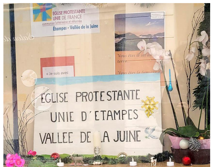
La nouvelle vitrine de l'église, MERCI à Danielle