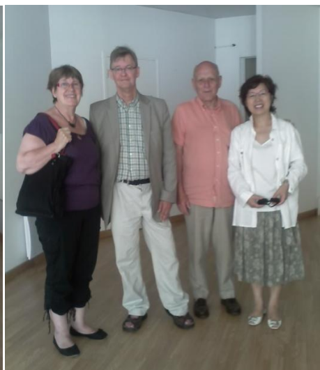
Le jour de la réception de la clé, Rue de la Juiverie, le 30 juin 2009.