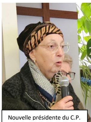
Nouvelle présidente du C.P.

Lors de notre dernière AG, l'assemblée a validé le nouveau bureau.