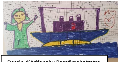
Dessin d'Arifanahy Razafimahatratra

Qu'est-ce qui nous fait perdre l'essentiel aujourd'hui ? Qu'est-ce qui nous fait oublier cette certitude profonde : quoi qu'il arrive, nous sommes aimés de Dieu, quel que soit le contexte culturel, social ou économique dans lequel nous vivons ? La Bible raconte que le peuple d'Israël a souffert pendant