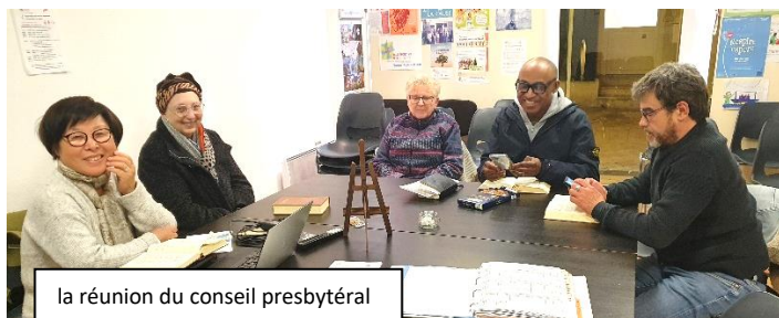
la réunion du conseil presbytéral

Continuons à nous investir car chacun a reçu un don particulier qui ne peut être remplacé par un autre. Mis en commun, ils