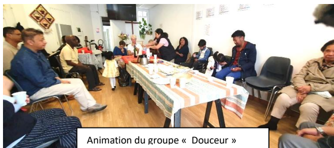
Animation du groupe « Douceur »

En avril , c'est dans l'unité que nous avons célébré la Résurrection. Lors de l'Aube de Pâques à 7h, nous avons vécu une célébration œcuménique fraternelle avec l'Église Catholique d'Étampes, nous rappelant que nous formons un seul corps en Christ.