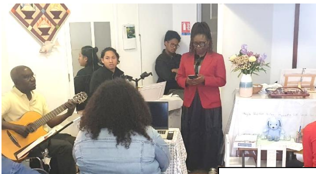
Animation du groupe « Maîtrise de soi »