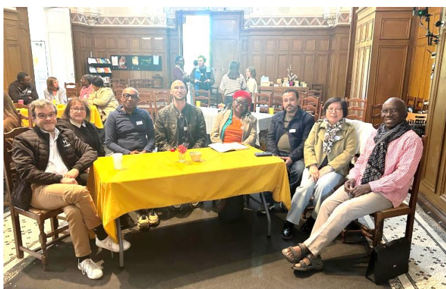
Parcours Alpha de quatre paroisses: Epu du Marais

La projection de la vidéo, portant sur les interrogations et les témoignages au sujet du Saint